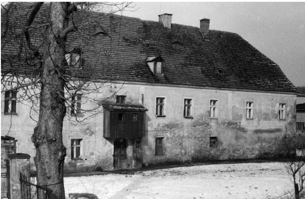
Widok budynku mieszkalnego od strony ul. Świerczewskiego