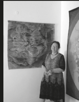
Szklarska Poręba, wernisaż B.B.N.Burgielskich – Pokoleniowy Wątek