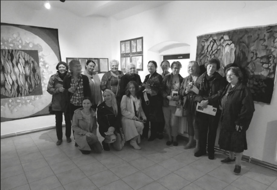
Szklarska Poręba, wernisaż B.B.N.Burgielskich – Pokoleniowy wątek