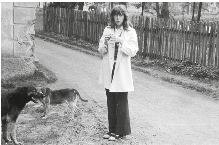
Autorka artykułu tuż przed opuszczeniem domu na zawsze