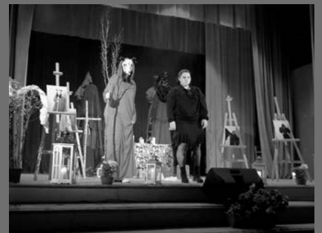
„Dziady 2.0 – Głosy z Sieci”

31 PAŹDZIERNIKA na terenie Kowar miało miejsce niezwykle wydarzenie, jakim był spacer historyczny pt: „Powrót kowarskich legend”, zakończony przedstawieniem teatralnym pt: „Dziady 2.0 – Głosy z Sieci”, wystawianym przez uczniów ZSO Kowary.