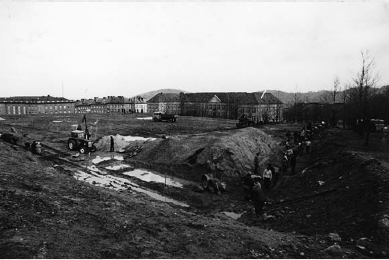
Boisko przy ZSO w trakcie budowy...