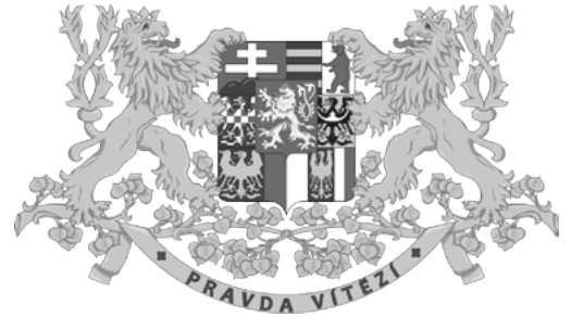
Duże godło Czechosłowacji opracowane w 1918 roku