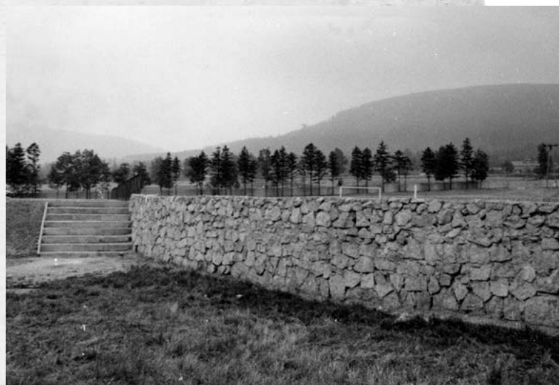
Stadion Miejski w trakcie prac