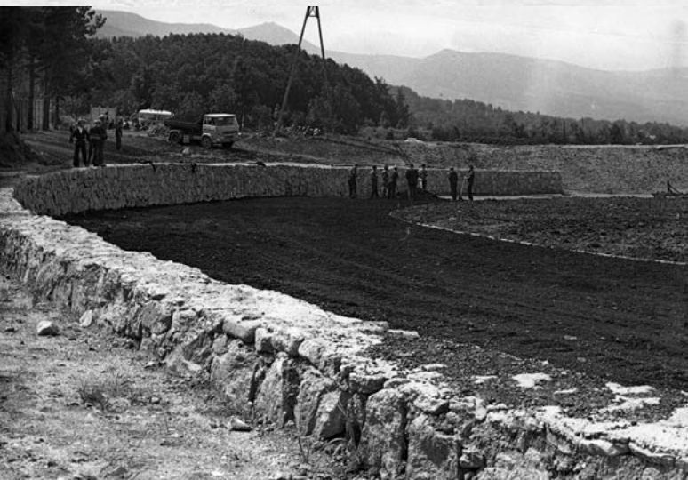
Stadion Miejski w trakcie prac