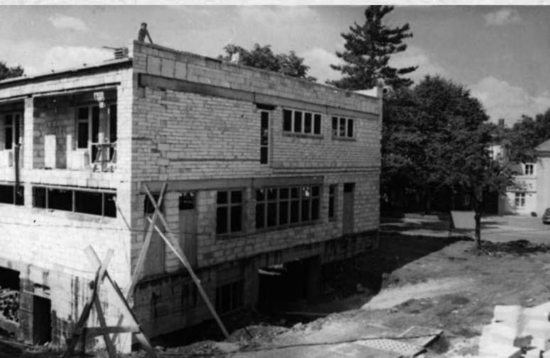
Kuźnica w trakcie budowy