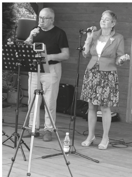
Koncert duetu wokalnego „Kowary”