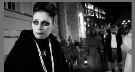
Wieczorny spacer po Kowarach obfitował w historyczne niespodzianki