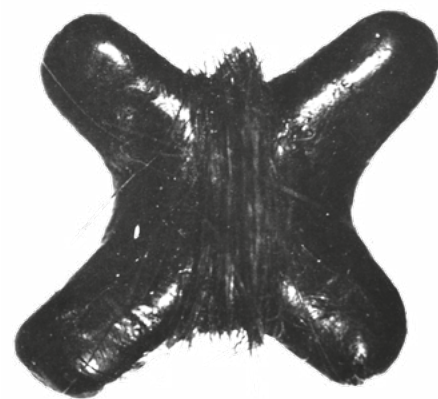
Truszuł balenca – włochaty krzyż

Wojna i zagłada Romów przerwały ciągłość tej tradycji. Utracono wiele rodzinnych sekretów przekazywanych z pokolenia na pokolenie.