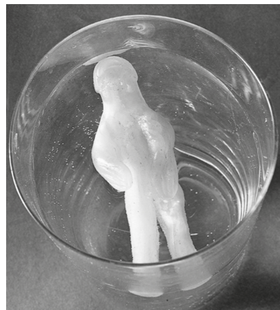
Mułoro – trupek

Dziś romskie wróżbiarki powoli znikają z ulic, lecz sama sztuka wróżenia nie umarła – przeniosła się do mieszkań stylizowanych na gabinety i do internetu. Wciąż jednak zaspokajają te same ludzkie pragnienia, które towarzyszą człowiekowi od tysięcy lat: miłość, szczęście, powodzenie i nadzieję na lepszy los.