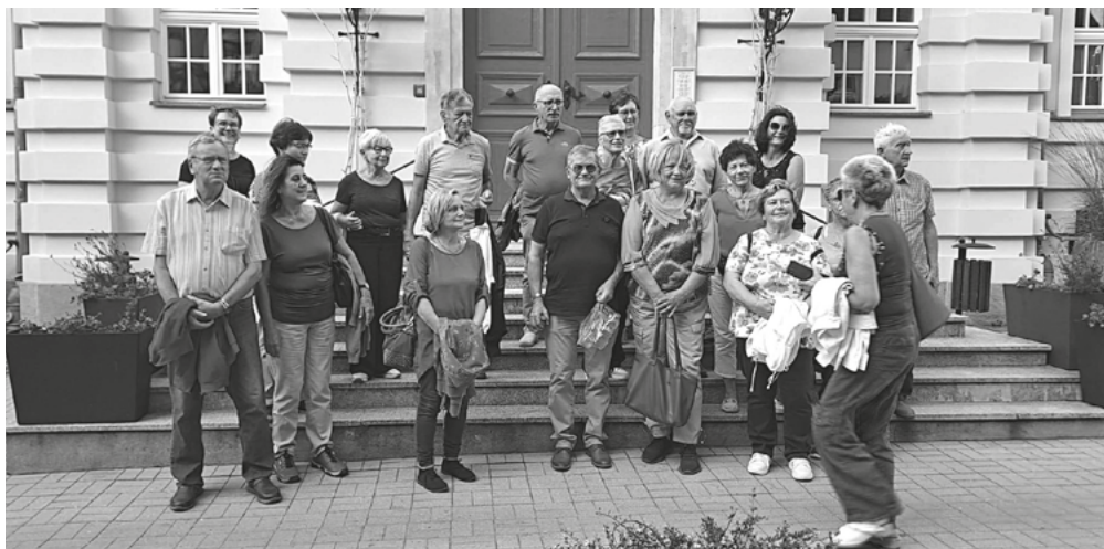
Wizyta przyjaciół z Schönau-Berzdorf