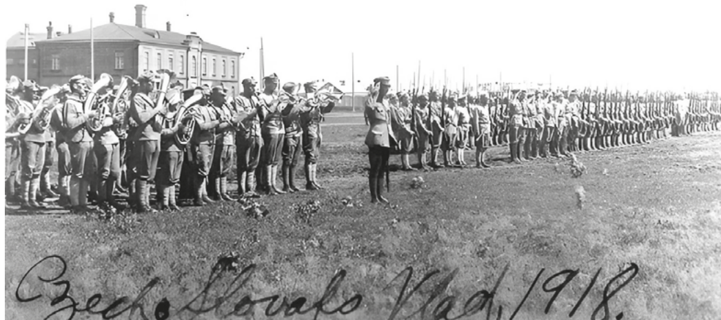
Czechosłowacki legion we Władywostoku w 1918 roku