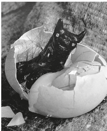
Bengoro – diabełek

Romskie wróżki rzadko pracowały samotnie. Zazwyczaj chodziły parami lub w grupach, z córkami i kuzynkami, które przyuczały się do zawodu. Wierzono, że zdolności magiczne przechodzą z matki na córkę, a szczególną moc posiada siódma córka siódmej córki.