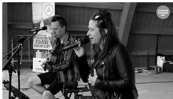
Zespół Suplement Diety