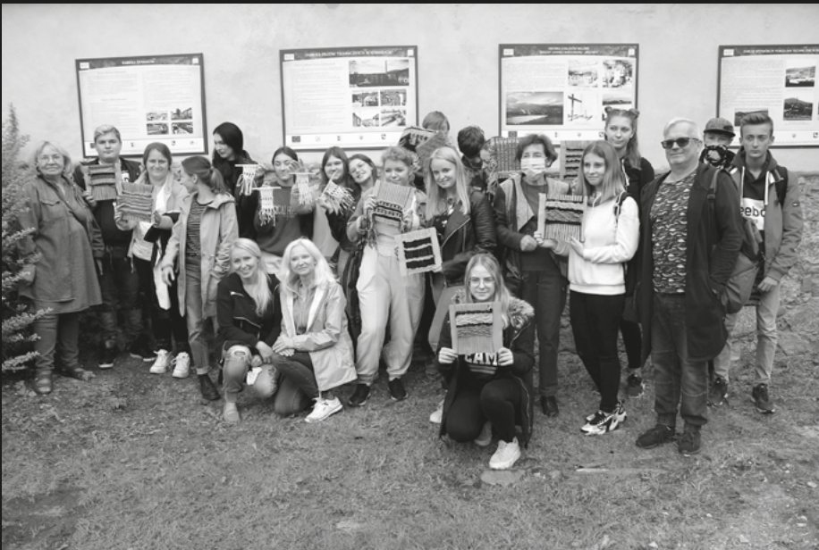
Uczniowie szkół kowarskich z mini tkaninami po warsztatach z artystami w SMK