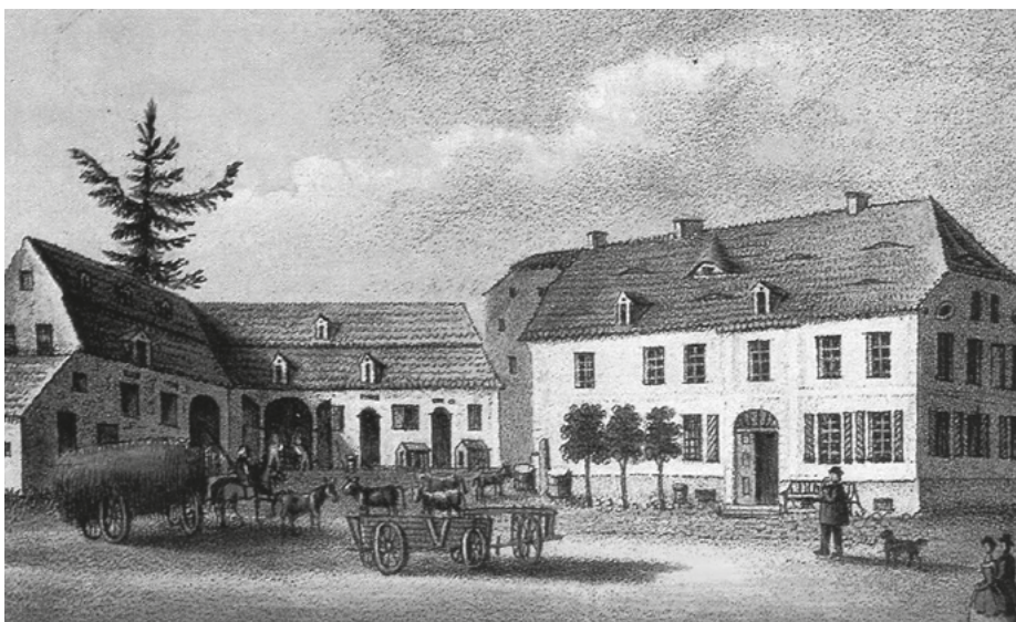
W .Knipel; zajazd Stadenhof w Kowarach. Litografia kolorowa, XIX w.