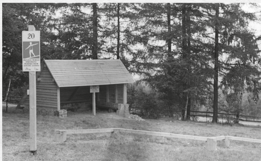
Wiata przy Ścieżce Zdrowia

Kowary przystąpiły do tej rywalizacji trochę w cieniu bardziej znanego kurortu, jakim były Głuchołazy, które w głosowaniu uzyskały ogromną przewagę nad Kowarami. Przytłaczający rozmiar porażki w pierwszej części turnieju był dla kowarzan jak zimny prysznic, ale podziałał niezwykle mobilizująco. Niebawem po lutowej prezentacji w Kowarach przystąpiono do organizowania szczegółowego harmonogramu prac. Wyznaczono kierowników „budów” i pierwsze prace ruszyły wczesną wiosną. W miarę upływu czasu wzrastało zainteresowanie udziałem w tych pracach ze strony mieszkańców, podejmowano też dodatkowe zobowiązania. Koordynatorem tych działań był Urząd Miasta, którego pracownicy znakomicie spisywali się w tej roli, choć w obliczu ciągle nowych inicjatyw mieszkańców, niekiedy miewali kłopoty z dostarczaniem materiałów budowlanych. Warto podkreślić, że oprócz zorganizowanych grup roboczych z miejscowych zakładów pracy, spontanicznie zgłaszały się do pracy mieszkańcy miasta, którzy zawodowo pracowali w innych miejscowościach, a w miejscu mieszkania chcieli upiększać swoje otoczenie. Na taką postawę zapewne miał wpływ wynik głosowania widzów.