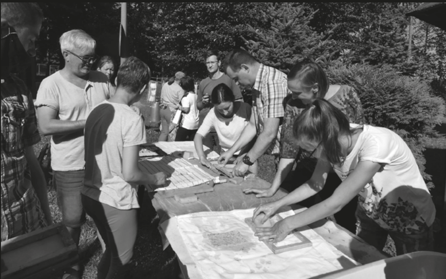
Warsztaty twórcze dla Uczestników WTZ Kowary