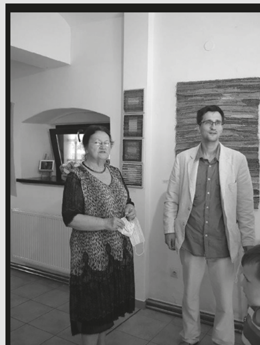
B. B. N. Burgielscy, Pokoleniowy wątek