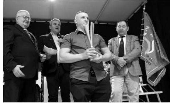
Uroczystość rozdania nagród hodowcom gołębi