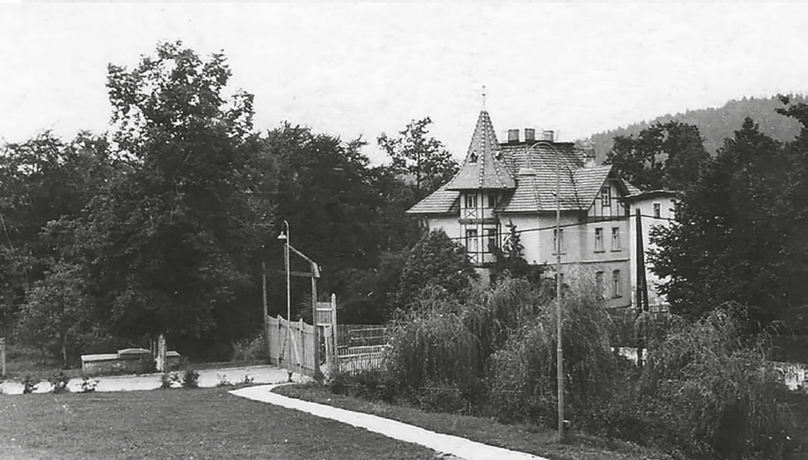
Brama wjazdowa na osiedle Wysoka Łąka