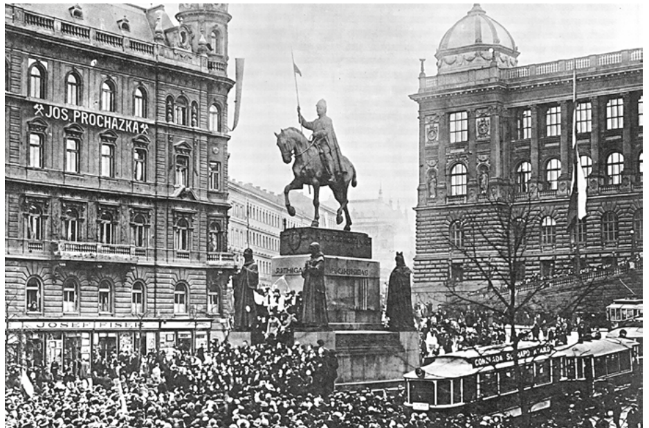
Entuzjazm praskiej ulicy na Placu Wacława po ogłoszeniu powstania Czechosłowacji w 1918