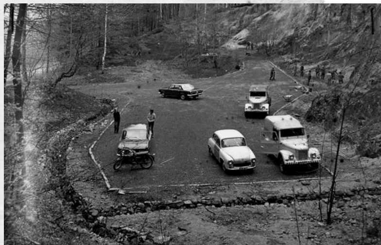
Parking przy Źródleku nad Językiem Teściowej