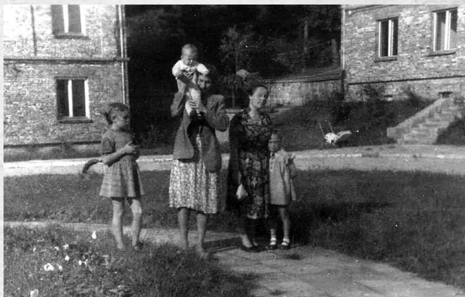
Bloki przy ul. Jagiellońskiej

Podobna sytuacja miała miejsce na osiedlu specjalistów radzieckich „Wysoka Łąka”, które zostało wybudowane przy ul. Jagiellońskiej w dzielnicy Wojków. Sama historia tego osiedla była bardzo ciekawa, bo tutaj od początku powstania 3 bloków z czterdziestoma bardzo komfortowymi i przestronnymi na owe czasy mieszkaniami zamieszkiwali inżynierowie, geolodzy i kadra nadzoru technicznego, sprowadzona ze Związku Radzieckiego. Samo osiedle było odgródzone od pozostałej części Wojkowa oraz całodobowo strzeżone przez milicjantów. Do dzisiaj można zauważyć pod lasem betonowe podpory w miejscu, gdzie stała wiata, pod którą