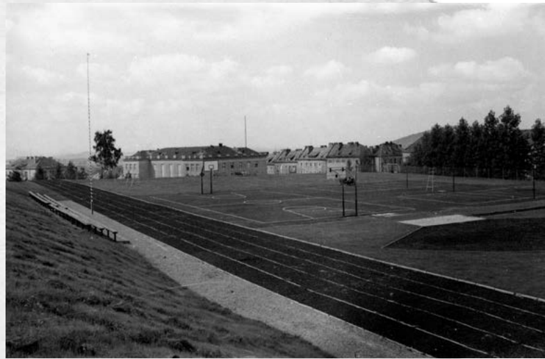
...to samo boisko po zakończeniu prac